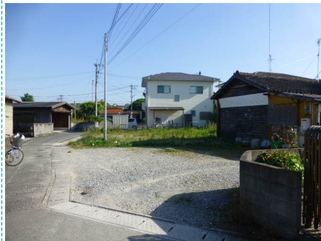
前面道路含む現地写真 北側より撮影