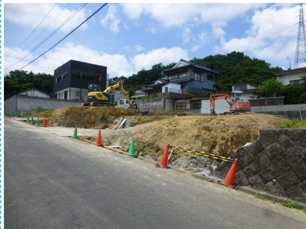
前面道路含む現地写真 1号地・2号地