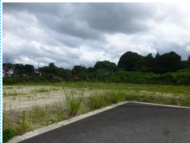
4号地 約102坪 1331万円