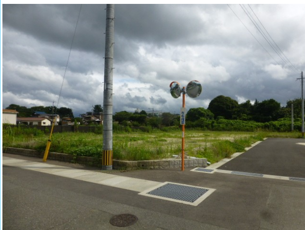
6号地 約111坪 1443万円