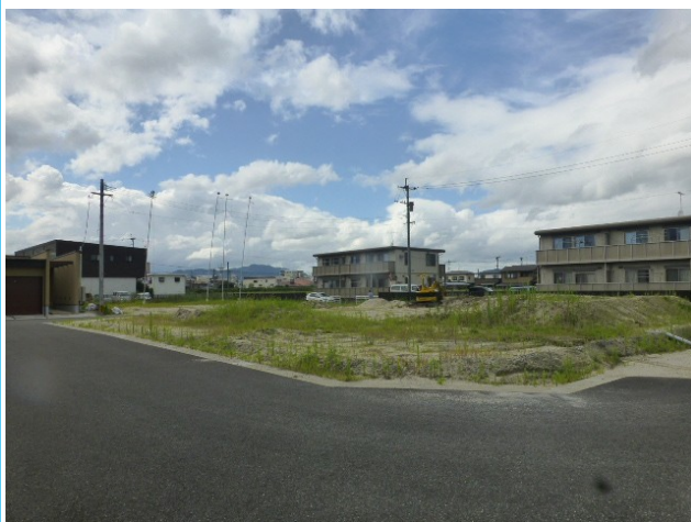
7号地 約98坪 1284万円

閑静な住宅地にあり生活の利便性も高い場所です！菰田小学校まで約5 16m徒歩7分！飯塚駅まで約858m 徒歩11分！