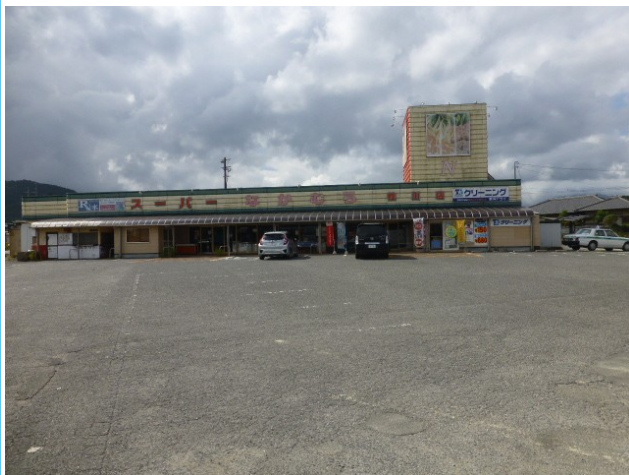
建物は含まれていません。