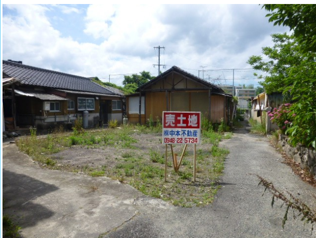
2項道路を含む現況写真