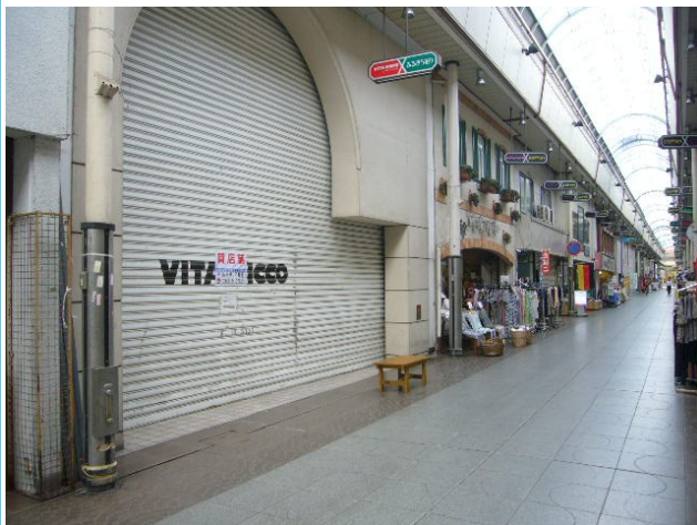
ふるまち通り側より撮影