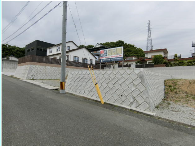
前面道路含む現地写真