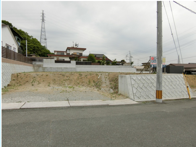
前面道路含む現地写真