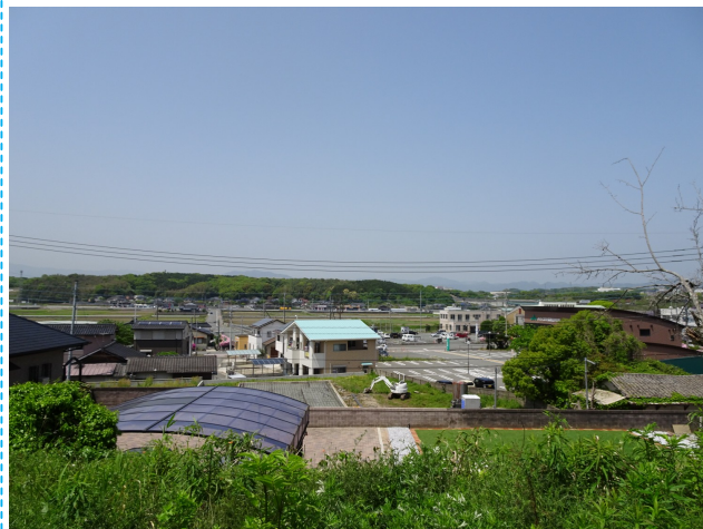
高台からの景色が良好です！