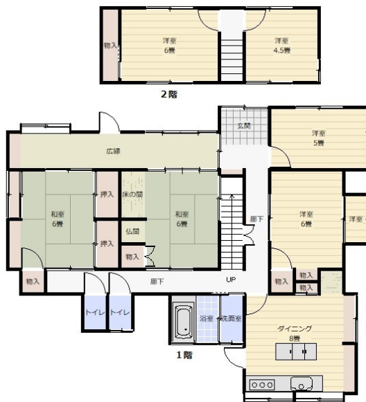
現況と異なる場合は現況を優先いたします。