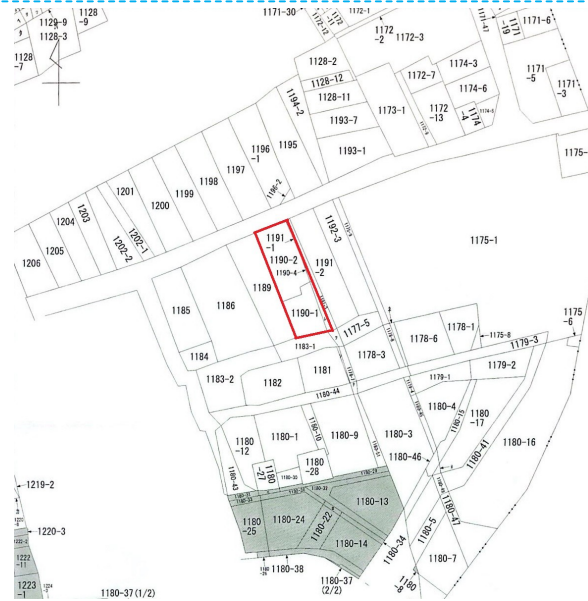
字図 現況と異なる場合は現況を優先します。