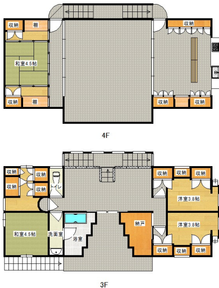
3F・4F 現況と異なる場合は現況を優先します。