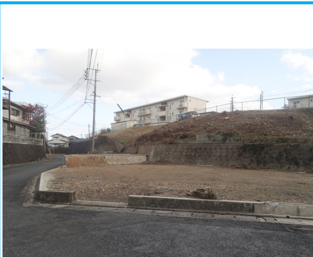
西側道路より撮影