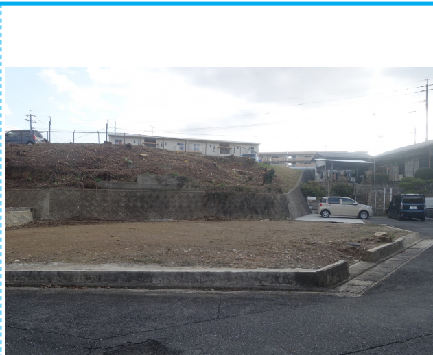
北側道路より撮影（南側の崖に面しています）