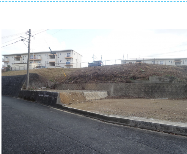
北西側道路より撮影（敷地内に高低差があります）