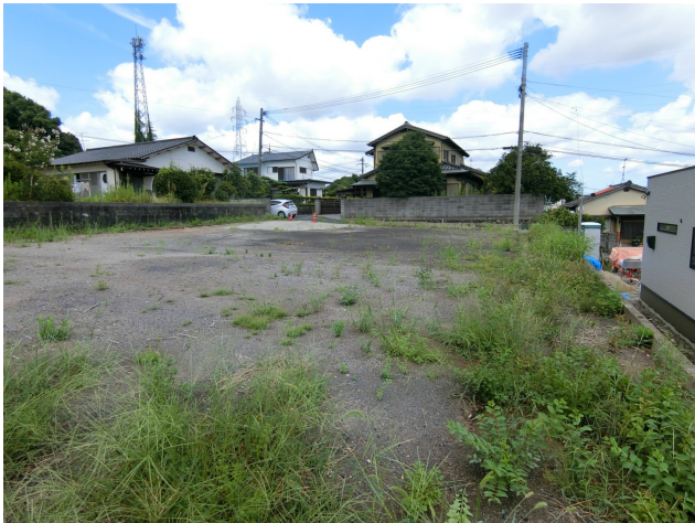
南側道路より撮影