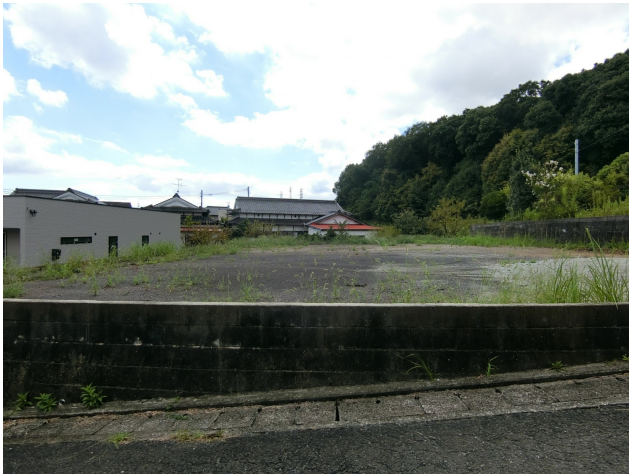
北側道路より撮影