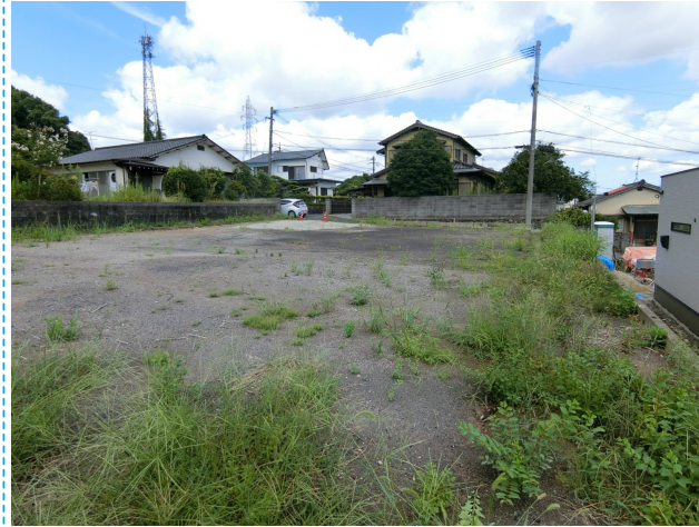
南側道路より撮影