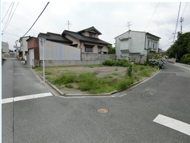
北東側道路より撮影