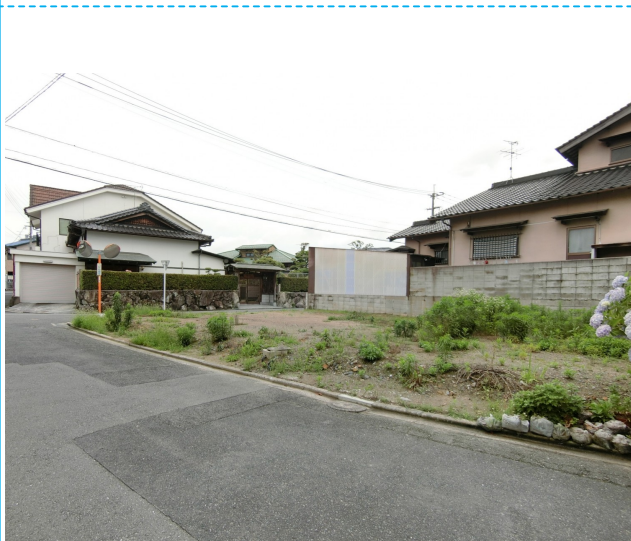
北西側道路より撮影